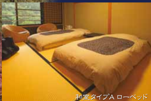
和室タイプA ローベッド