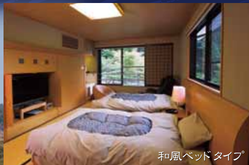
和風ベッドタイプ