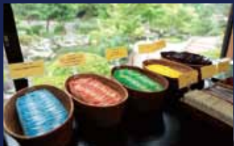
フリードリンクコーナー